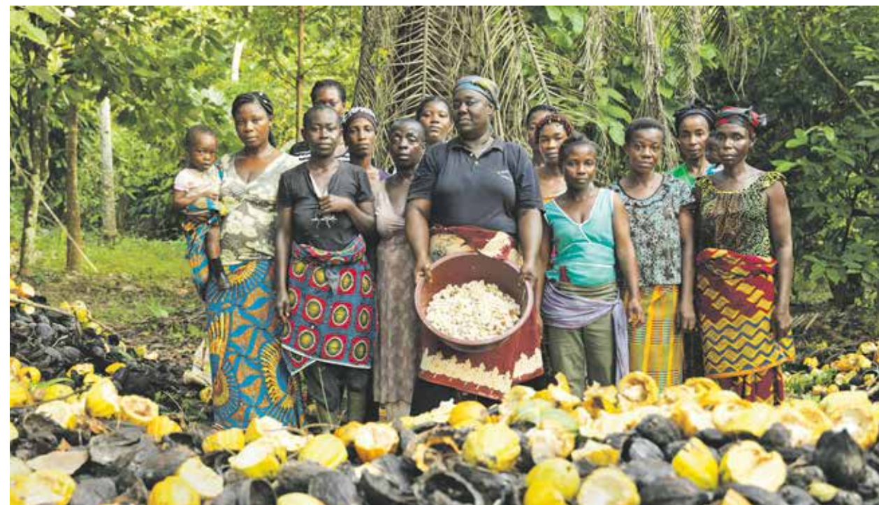
Zusammen stärker: Kleinbauernkooperativen können bessere Preise erzielen

Existenzsicherung Zu niedrige Löhne sind ein fundamentales Problem. Wie gegensteuern?