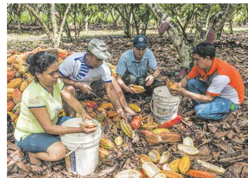
Einkommen variieren von Land zu Land, von Peru (u.) bis Ghana

Die ersten Anker-Referenzwerte und Länderprofile werden Burkina Faso, die Côte d'Ivoire, Peru und Ruanda abdecken. Weitere 16 Referenzwerte und Länderprofile werden im Laufe des Jahres veröffentlicht – das bedeutet, dass mehr Fairtrade-Herkunftslander als je zuvor abgedeckt werden.