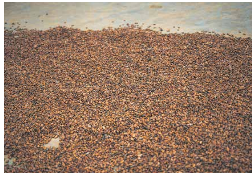
Von der Bohne bis zum Kakao-Produkt ist es ein langer Weg, an dem viele Hände beteiligt sind. Wer die manuelle Arbeit leistet, hat davon oft am wenigsten

Hütz-Adams: Der Verweis auf Fairtrade in dieser Diskussion zeigt, wie nötig ein Gesetz ist.